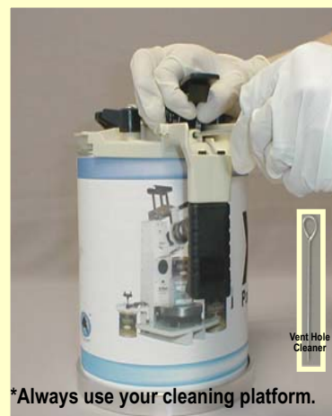
*Always use your cleaning platform.