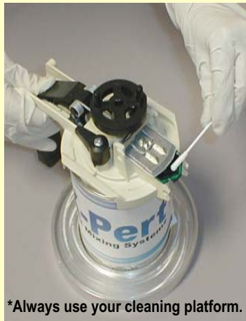
*Always use your cleaning platform.