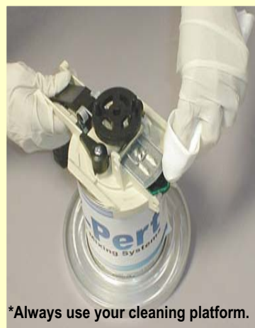
*Always use your cleaning platform.